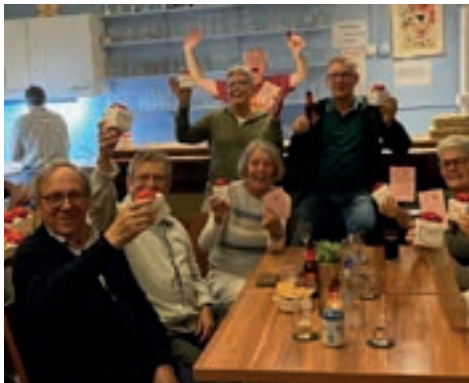
Iedereen een kadootje

Namens bestuur Petanque Vereniging Sprang-Capelle