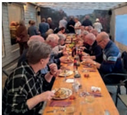
lekker chinees eten