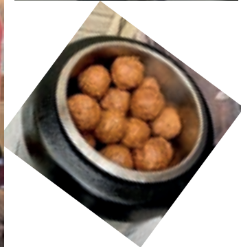
Broodje Bal boule Toernooi